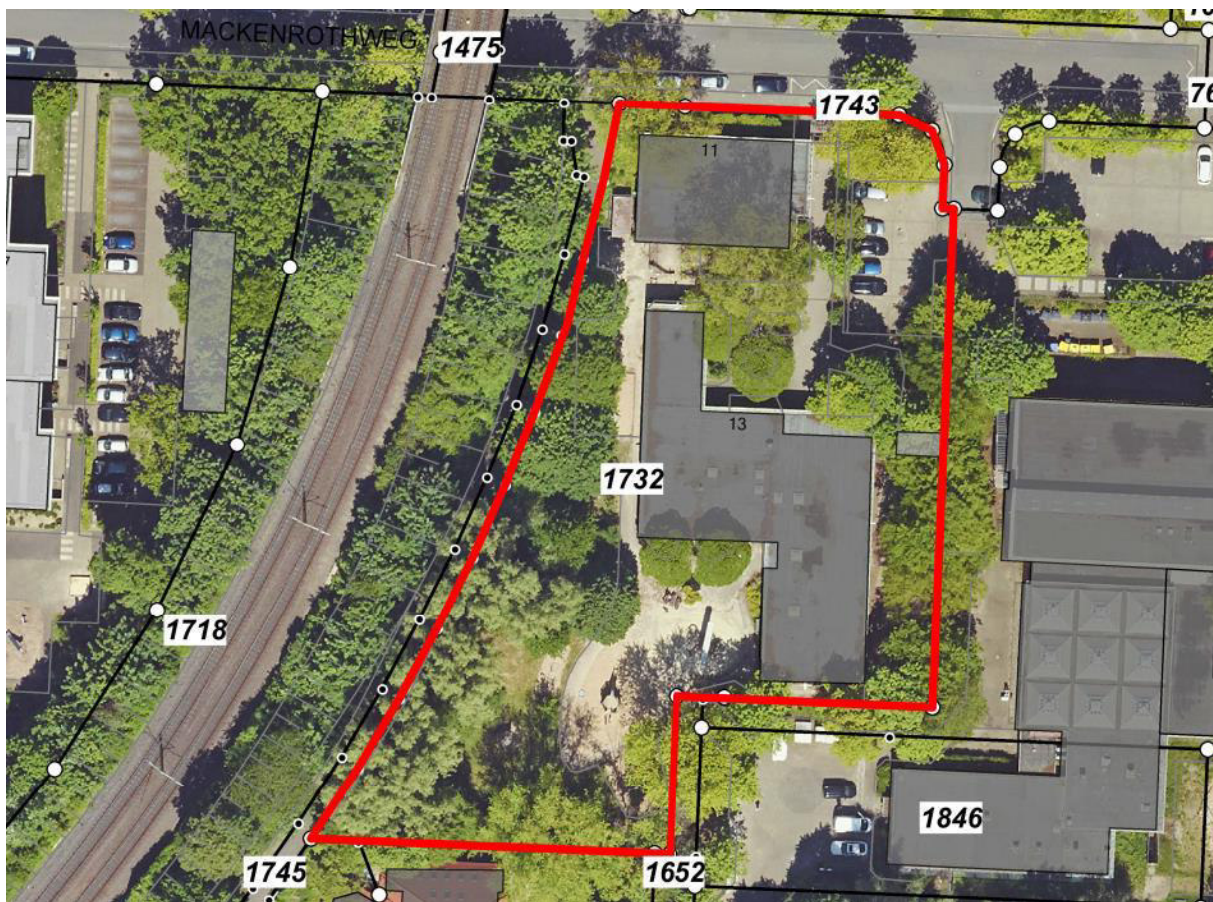
Luftbild mit Darstellung des Grundstücks Abb.03