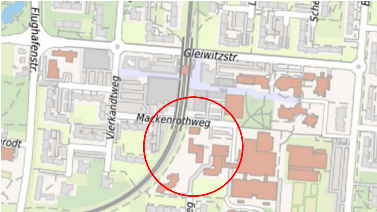
Lageplan (Grafik: Stadt Dortmund) Abb.02